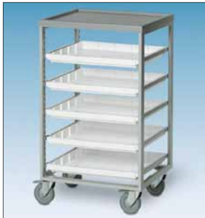
79102 Siirtovaunu 500 x 450 x 850, 5 tarjotinta. Pyöristä kaksi jarrullista. Vaunu voidaan varustaa myös laminaattipintaisella kannella.