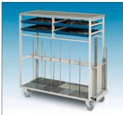
79172 Statiivivaunu 1000 x 450 x 430.