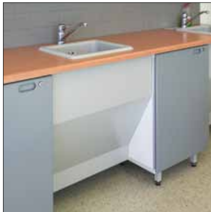
77032A Työpöytä säilytysyksiköllä