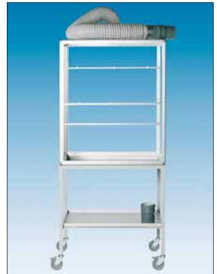
77022 Vetokaappi pyörillä