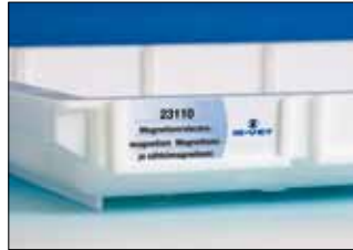
Hyllyjen sisällön merkitseminen on vaivatonta. Tarjottimen reunassa on 5 kpl nimikepidikkeitä, johon nimikelappu laitetaan. Näin hyllymerkinnät ovat aina esillä ja helposti vaihdettavissa.