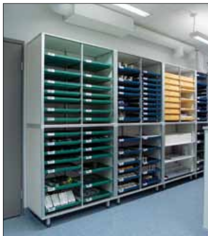
Kaksi 75281 säilytyskaappia (kaapeissa ylimääräisiä hyllytarjottimia).