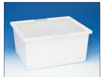
76153 Hyllylaatikko 450 x 390 x 200 mm 76154 Kansi 450 x 390 mm