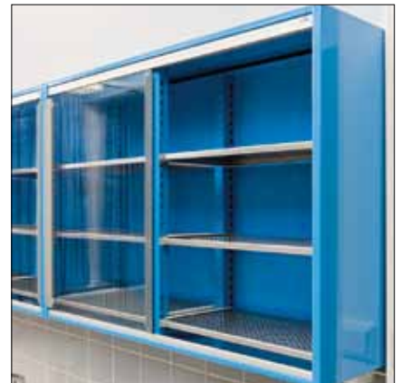
79651L Kuivauskaappi RST-kuivaushyllyillä.