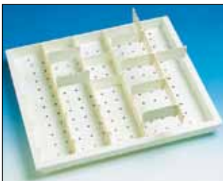
Osastoitava ja korotettava hyllytarjotin on kalustejärjestelmän vakiohylly.