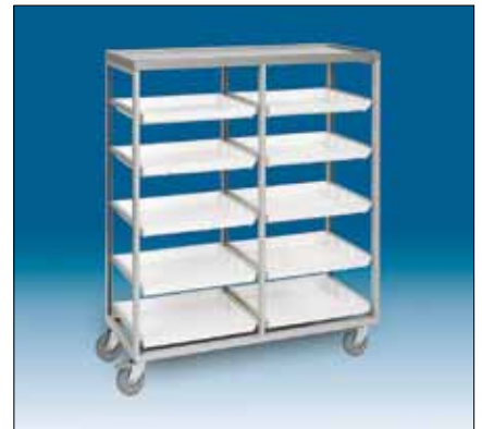
79175 Siirtovaunu 1000 x 450 x 1130, 10 tarjotinta.