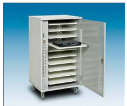
77052PC-vaunu 620 x 535 x 1120, 10 koneelle.