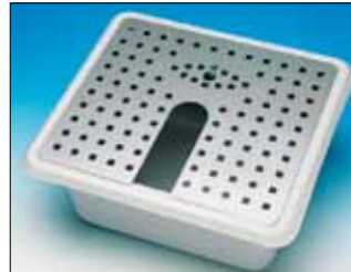
76112 ja 76112B