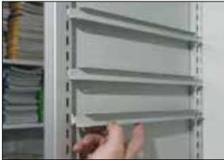
Metalliset hyllykannakkeet ovat aseteltavissa 25 mm:n väleihin.