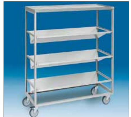
79173 Kirjavaunu 1000 x 450 x 1130.