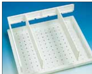
Korokereunoilla hyllytarjottimeen 50 mm korotus.