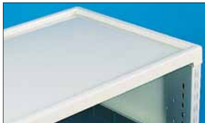
Koska siirtovaunujen kansi on kaukalomainen, välineet eivät putoile vaunua liikuteltaessa.