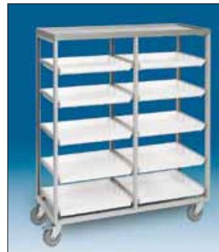
Siirtovaunujen avulla tarjottimet ovat helposti siirrettävissä varastosta luokkaan.