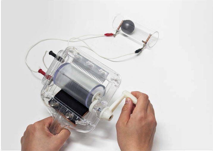
26002 Generaattori, käsikäyttöinen 10 kV, hankaussähkö 312,89 €

Hinnat alv 0% vapaasti varastossamme, lisalmi. Tarkemmat tekniset tiedot tuotteista löytyvät verkkokaupastamme isvet.fi