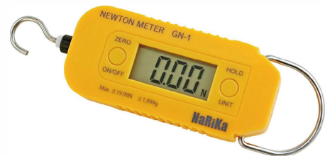
27019 Voimamittari, digitaalinen + 20 N / 2000 g 64,04 €

Helppokäyttöinen ja kestävä generaattori, joka tuottaa sähköä kampea kääntämällä. Jännitteen yläraja on 12 V. Useita generaattoreita voidaan käyttää samanaikaisesti, kytkeä sarjaan tai rinnan laitteiden käyttämiseksi. Monipuolinen laite käytettäväksi generaattorina, moottorina tai virtalähteenä jne. Vaihtosarja myydään erikseen siltä varalta, että sisäinen vaihteisto rikkoutuu tai on kulunut. Vaihteiston saa nimiketunnuksella 24204.